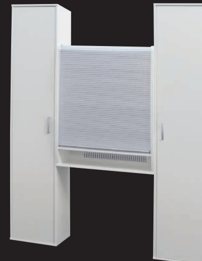
Hochstehend als Zwischenbauteil Upright between cabinets