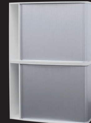
Querstehend gestapelt Horizontal stacked