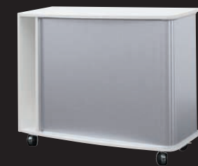
Querstehend auf Rollen Horizontal on castors

The rounded roller blind element can be used as an upright, stacked or hanging unit between cabinets. A set of castors is available to add mobility to the roller blind element. The storage shelf with CD rack provides optimum order in the office.