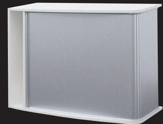
Querstehend auf Sockelfüßen Horizontal on a plinth base